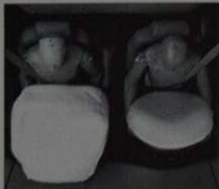
Équipement similaire des deux variantes de sécurité