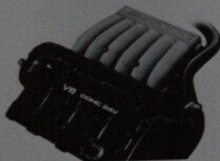
Moteur de 3 L à DACT et deux turbocompresseurs

*Bouclez toujours votre ceinture de sécurité.